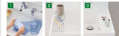
バケツの水汲みや衣類のつけ置き洗いもしやすいです。コップや泡立てネットなど、濡らしたくないものを、一掃れものを気兼ねなく置けます。同時に便利です。