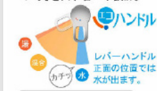
お湯が混合する位置はクリックでお知らせします。