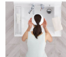
洗顔・洗髪もゆったりスペースで