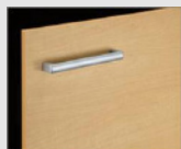
□ LP2 クリエール