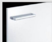
□ YS2 グロスホワイト