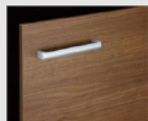
□ LM2 クリエル