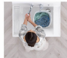
つけ置き洗い中も、バケツを避けての手洗いもOK