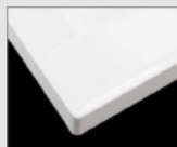
□ H ブレンスホワイト