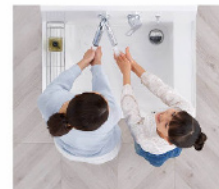
2人並んでの身支度もスムーズ