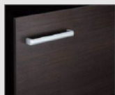
□ LD2 クリエーク