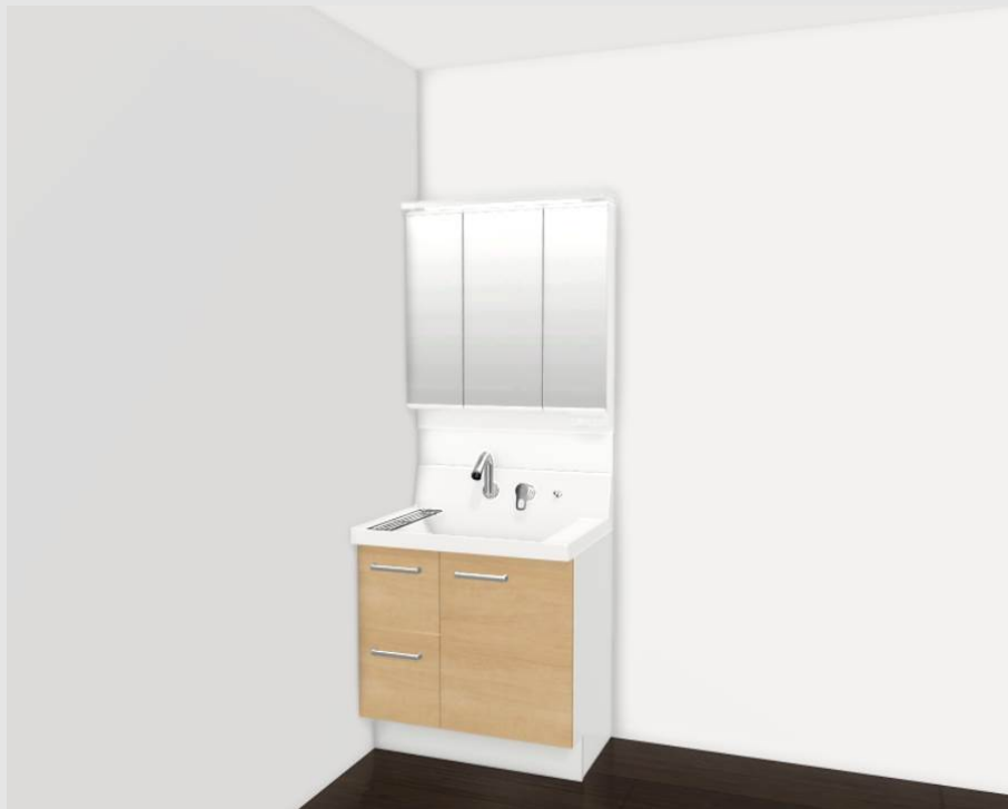
CG合成によるイメージ画像です。