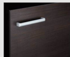
□ LD2 クリエグーク