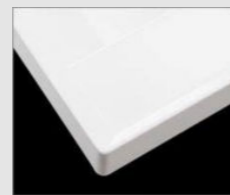
□ H フレン材ホワイト