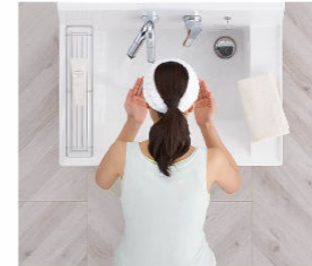
洗顔・洗髪もゆったりスペースで