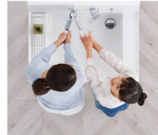
2人並んでの身支度もスムーズ