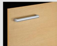
□ LP2 クリエベール