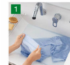
バケツの水汲みや衣類のつけ置き洗いもしやすいです。