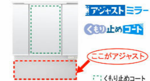
※写真は間口900mm。アジャストミラー3面鏡(スリムLED) MAJX2-753TZJU