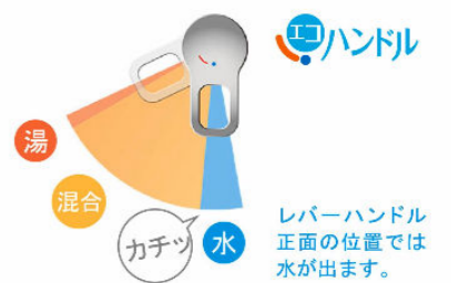
お湯が混合する位置はクリックでお知らせします。