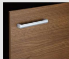
□ LM2 クリエモ