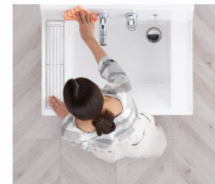
汚れにくくお掃除もカンタン