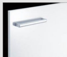
□ YS2 ゲロスホワイト