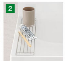
コップや泡立てネットなど、濡らしたくないものを、一つ置き洗いをしやすくなります。