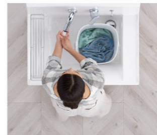
つけ置き洗い中も、バケツを避けての手洗いもOK